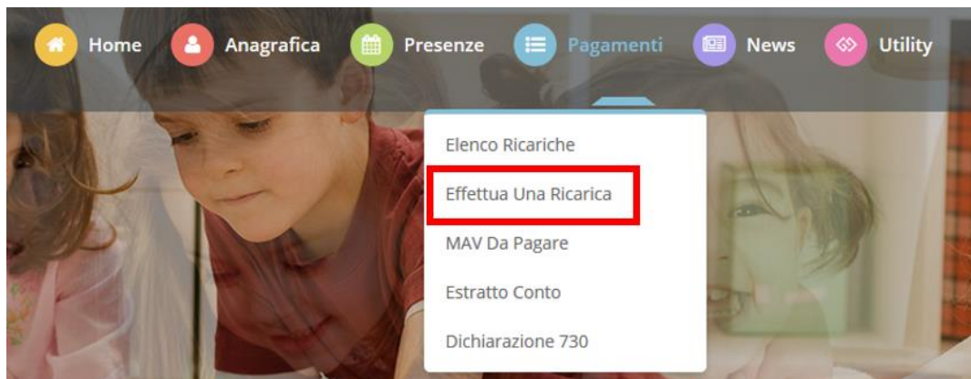
Figura 1 - Menu Pagamenti – Effettua una Ricarica

Selezionando la voce di menu, si aprirà un'altra pagina in cui si potrà scegliere l'importo da ricaricare tramite gli appositi talloncini o indicare un importo personalizzato