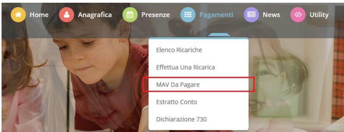
Figura 4 – Elenco MAV da Pagare

Si ricorda inoltre che il MAV, una volta effettuato il pagamento, sarà visualizzabile tra le vostre ricariche effettuate entro 24/48 ore.